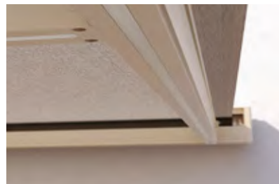
PERGOLINO | RIVERA

Die Position der Konsolen und Führungen sowie die Neigung können vor Ort den Gegebenheiten angepasst werden und bieten eine hohe Montageflexibilität.